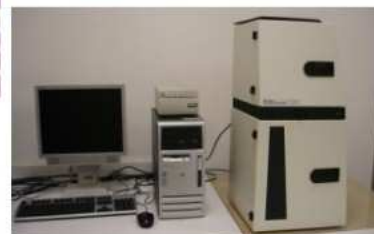
Analyse des protéines cellulaires