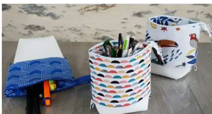
Pots à crayon/ Trousse 12 €