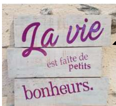
Panneaux décoratifs 15 €