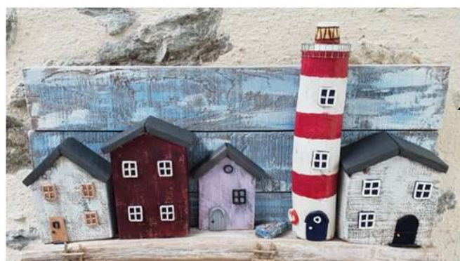
Phare (porte-clés) 45 €

L'ATELIER « Petites Mains » continue à travailler différents que ce soit en couture ou les articles bois qui sont mis à la vente au profit de Leucémie Espoir 49. Une autre façon d'aider les malades :